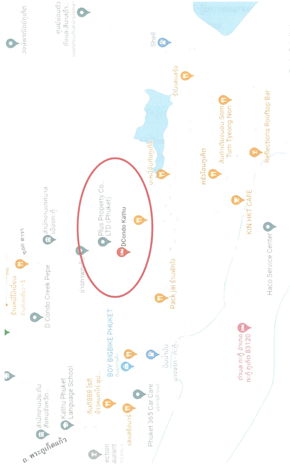
รูปภาพที่ 1.1 แผนที่ตั้งโครงการ ดี คอนโด กะทู้ (Top view)