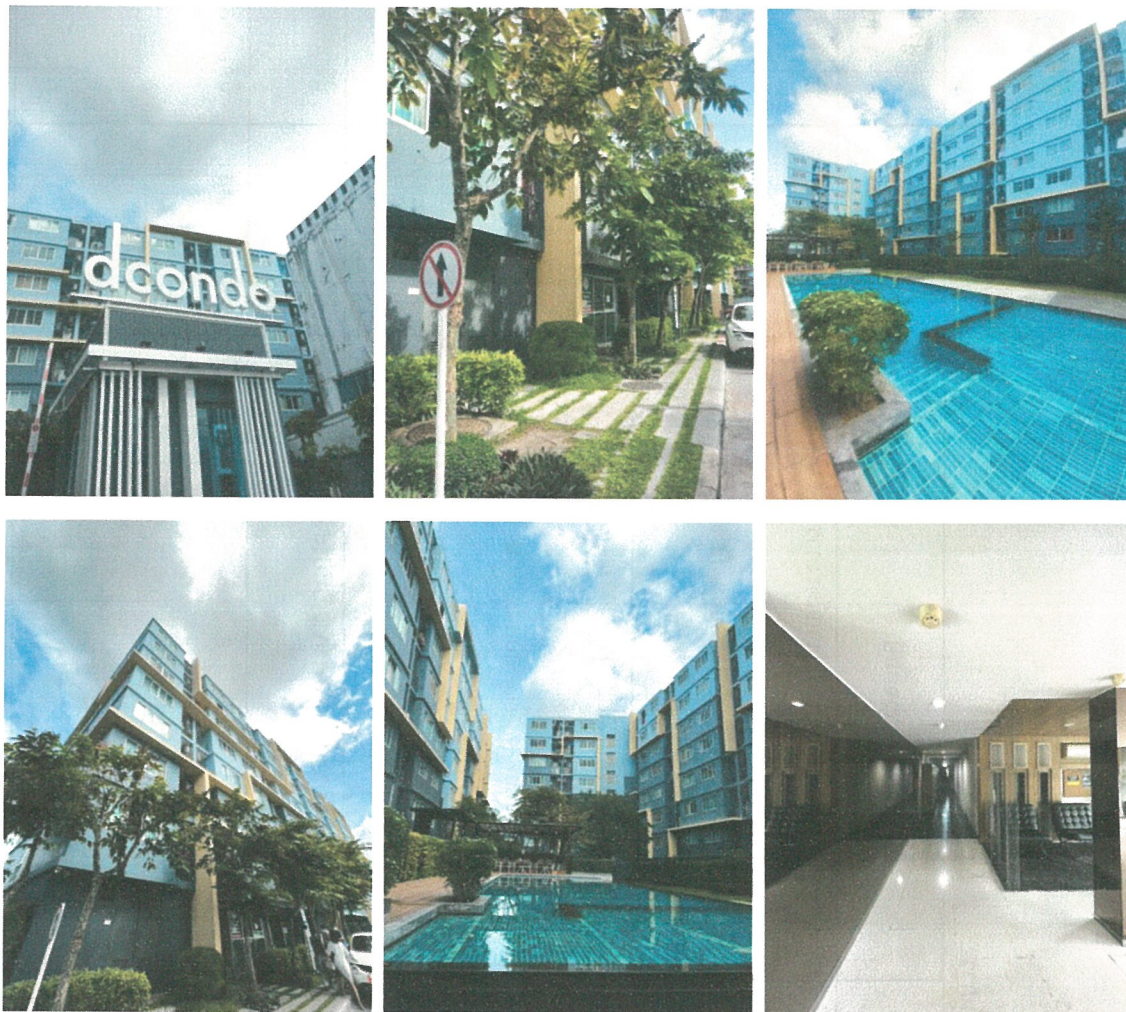
รูปที่ 1.4 การใช้พื้นที่อาคาร